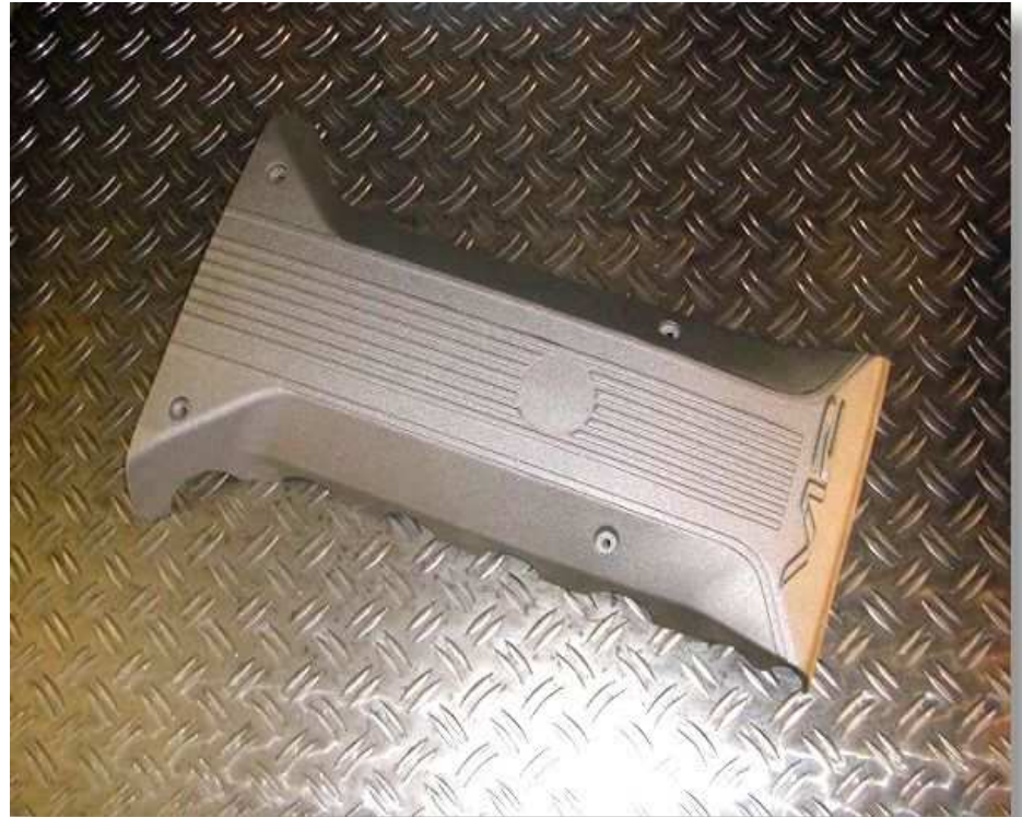
Schallschutzhaube ENGL-SSH M 730 6.1L