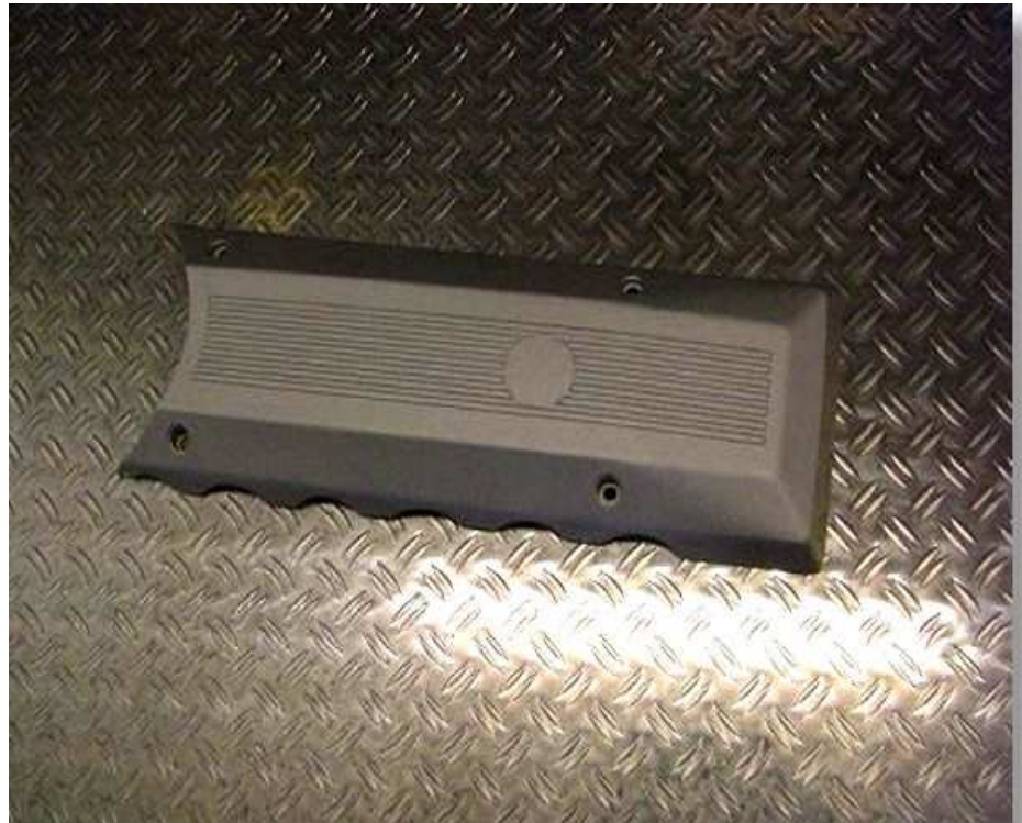
Schallschutzhaube ENGL-SSH M 70